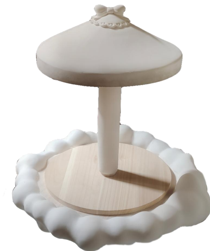
图 3-7 木马上层搭建图

将上层场景布置为具有绚烂神秘色彩的梦境世界，从线上购买色彩缤纷的小珠子进行布置，下面则布置为主人公在木马上熟睡的现实世界，将梦境世界与现实世界用云朵进行间隔，使观者能更好地区分梦境和现实世界，同时用云朵体现梦境若隐若现的意象，增添了梦境具有的模糊感。通过采购彩色玻璃进行搭建梯子，使主人公的梦境灵魂能够升到云朵之上的梦境世界，在玻璃的选择上采用七彩色，让其更为鲜明的体现故事情节。通过网上购买综合材料进行一些小的方面的点缀。部分场景元素运用模具制作，例如一些星星爱心等元素运用到作品上去。制作顶棚的花边要先测量圆的周长，但由于粘土干后会缩小，所以这个尺寸后期是要不断地调整打磨。在搭建时，首先要找好底座和顶棚的圆心点，确定支柱的位置，用木材胶进行粘连，待干后再进行云朵的粘连，最后将上支柱放进轴承中完成整体的搭建。