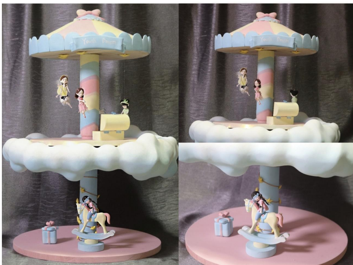
图 4-1 项目最终效果

梦境也作为符号和象征，它不仅反映了人类内心的状态和心理需求，也是文化和艺术表达的重要手段。对梦境和幻觉的解读和研究，可以帮助我们更好地了解自己和世界，发现我们的内在需求和潜在问题，同时也能够拓展我们的想象力和审美观念，本项目最终效果，如图 4-1 所示。