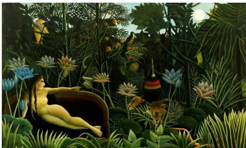
图 2-1 亨利·卢梭《梦境》

一些优秀的作品也给本项目提供了灵感来源。例如，亨利·卢梭的《梦境》，如图 2-1 所示，不该存在于热带雨林的红色沙发，为本项目设计提供了场所创作的灵感，拉斐尔的《骑士的梦》女神手中的剑、书籍、花朵分别暗示战功、智慧、爱情，为本项目人物设计提供了灵感，玛格丽特·康的大眼睛系列画作，以及大卫·林奇的电影《蓝色天堂》等都为本项目的设计提供了灵感。