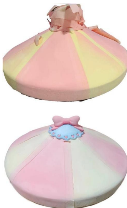
图 3-8 彩塑上色过程

彩绘是一种工艺性很强的一种手绘技艺，它需要复杂的工艺流程和考究的工艺技法。它可以在绘画、壁画、陶瓷等领域中得到应用。彩绘起源于古代，随着人类文明的发展和技术的进步，其制作工艺和应用方式也得到了改进和创新。