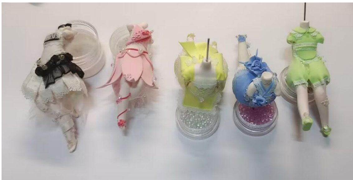
图 3-4 衣服的制作

制作服饰：等待身体完全晾干以后，制作衣服，将白色的超清粘土加水调成粘稠的糊状，用抹刀工具将其抹在蕾丝模具上，等待微微晾干后，用酒精棉片进行打磨，将镂空和不需要的地方去除，等待完全晾干后脱模备用。将粘土擀成片制作衣服的基础样式，再用泥条卷成玫瑰花的形状进行装饰，并且添加一些少女心的装饰品进行塑造。最后将各部分用胶水粘连，如图 3-4 所示。