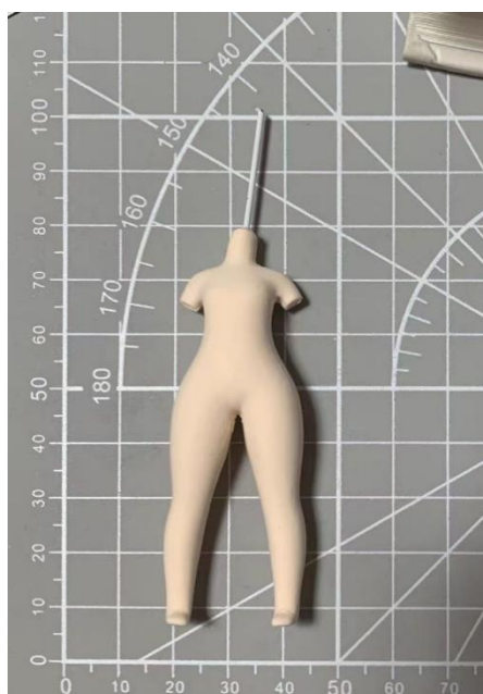
图 3-3 身体模具脱模过程

制作人体：把混合好的粘土按压在模具内，在按压过程中，不易按压进去的部位可以用工具着重处理，例如脚背等。用剪刀把多余的粘土去除，使模具内粘土与模具平齐，不平整的地方轻轻的用酒精湿巾进行打磨，不易脱模的地方可以用细节针进行处理，再轻轻的将粘土取出，这个过程需要有耐心的去处理。运用同样的方法来制作另一半，如图 3-3 所示。