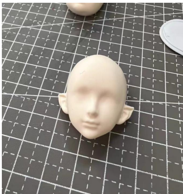
图 3-2 头部模具脱模过程

制作人体：把混合好的粘土按压在模具内，在按压过程中，不易按压进去的部位可以用工具着重处理，例如脚背等。用剪刀把多余的粘土去除，使模具内粘土与模具平齐，不平整的地方轻轻的用酒精湿巾进行打磨，不易脱模的地方可以用细节针进行处理，再轻轻的将粘土取出，这个过程需要有耐心的去处理。运用同样的方法来制作另一半，如图 3-3 所示。