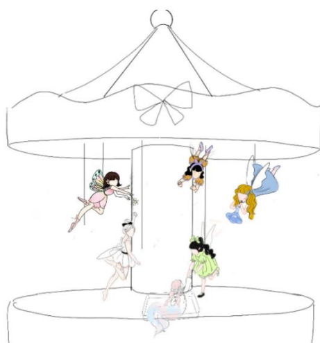
图 2-3 仙子形象设计

的物件，例如鲜花代表爱情、书本代表智慧、宝剑代表勇气等。主人公两次出现在作品当中，分别在现实和梦境场景出现，梦境中采用青春少年时期的主人公形象，而现实则采用成年后的主人公形象，将其进行了一个对比，突出人物跨越空间和时间的非理性，使本设计更具有梦的阶段性和跨越性，人物的身体也运用不同的材质加以区分，同时将往来的仙子设计为螺旋上升的摆放形式引导主人公向上探索，达到一种引导主人公探索真实自我内心的目的。青春少年时期，正是喜欢想象喜欢行动探索的时期，有许多天马行空的想法萦绕在脑海中，有一些则隐藏在更深处的潜意识里，通过梦境将其设计出来，以表达本人对内心的自我剖析与探索。