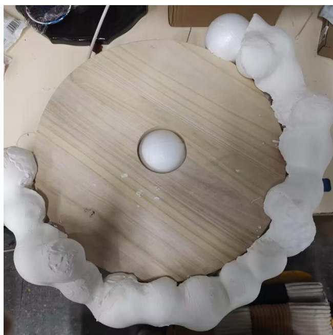
图 3-6 云朵制作过程