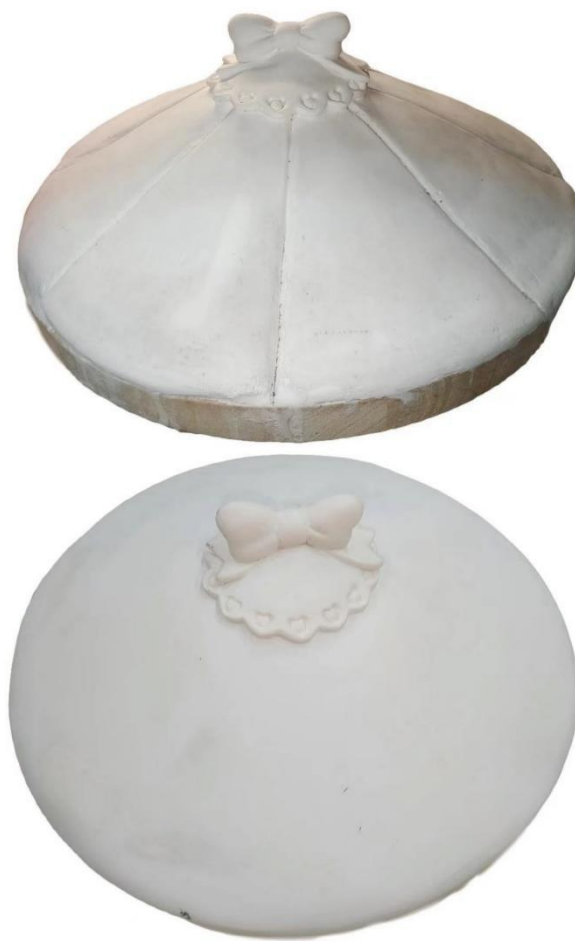
图 3-5 木马顶棚制作过程