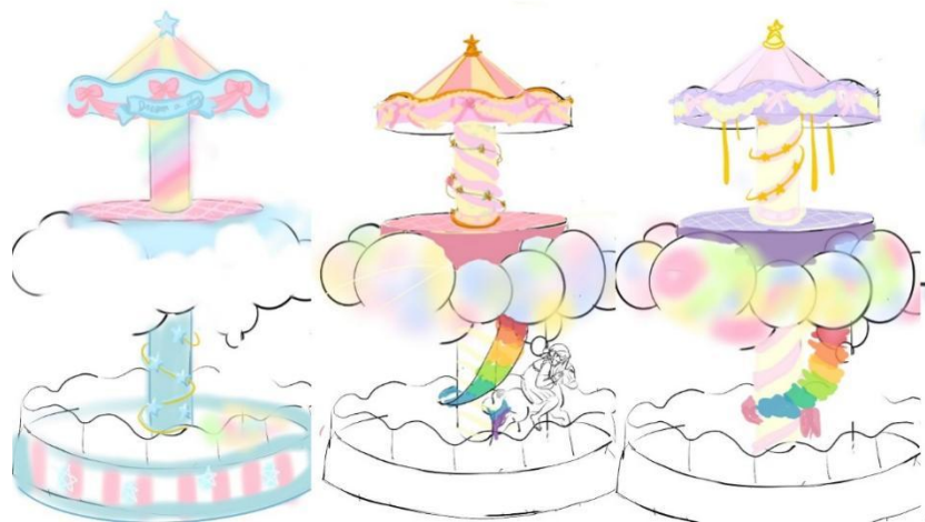
图 2-4 场景设计图

在场景的塑造上，在原有的旋转木马场景中加入了云朵的元素，使其与现实中的木马进行区分，在色彩上也采用了更加梦幻的塑造，如图 2-4 所示。