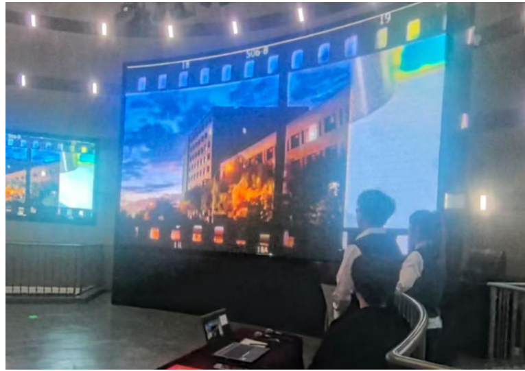
活动中播放《学长学姐，我想对你说》视频

活动中还播放了 2023 级、2024 级学生馆员们特别录制的视频短片《学长学姐，我想对你说》，“告白”即将退役的学长学姐并表示他们将不忘初心，不负众望，将“知识的守护者”社团全心全意为读者服务的精神传承下去。