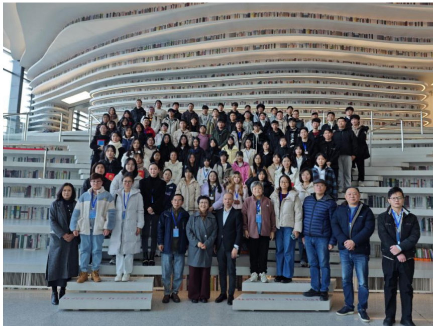
全体参加活动的师生在天津市滨海新区图书馆书山前合影留念

活动中还播放了 2023 级、2024 级学生馆员们特别录制的视频短片《学长学姐，我想对你说》，“告白”即将退役的学长学姐并表示他们将不忘初心，不负众望，将“知识的守护者”社团全心全意为读者服务的精神传承下去。