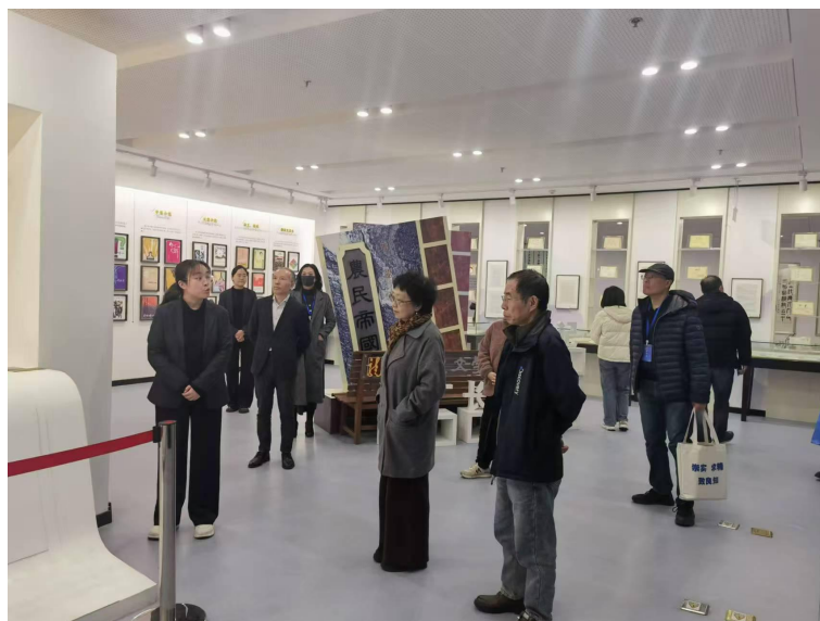
学校图书馆师生馆员及知联会教师参观天津市滨海新区图书馆