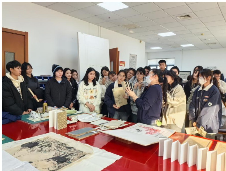
师生馆员参观古籍修复实验室