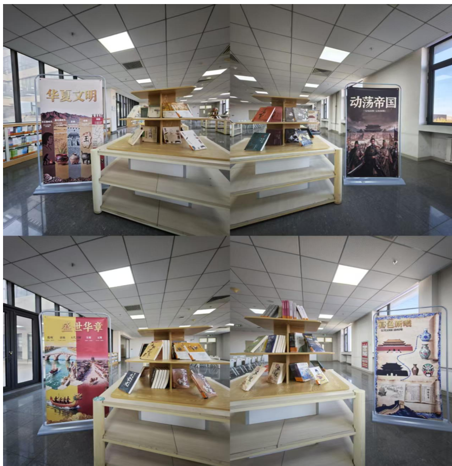
B 座四楼文社馆“历史与记忆”主题图书展览一角

文化典籍，在 B 座四楼文社馆以图书展览的形式引导师生在阅读中感悟历史与文化纵深与传承。