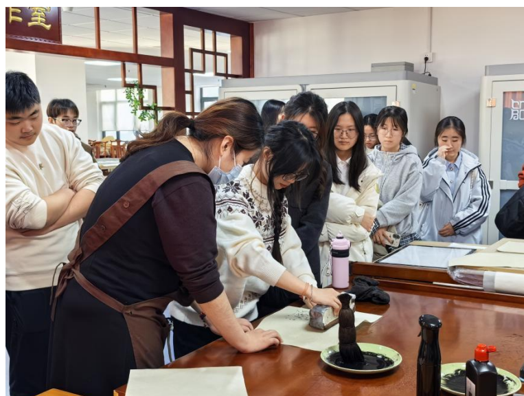
师生馆员体验雕版水印