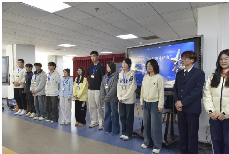
两校学长代表为“知识的守护者”社团 2025 级新生馆员佩戴工作证

“情怀的传承与回响”主题活动结束后，在天津师范大学图书馆古保院师生的引领下，我校师生馆员走进非遗文献展示区、古籍藏品库与修复实验室。在古保院教师的现场示范与讲解下，师生馆员们清晰了解到雕版水印从选版、固纸、