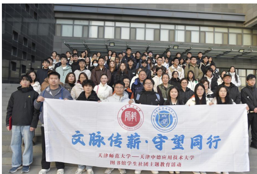
两校图书馆全体师生合影

本次活动不仅是两校图书馆之间的业务交流，更是两所有着不同办学特色的高等学校在文化育人方面的深度碰撞与融合。这次“同行”，让两校师生馆员在交流与实践体会到文化传承的意义与价值，注入了更坚定的文化自信与传承使命感。