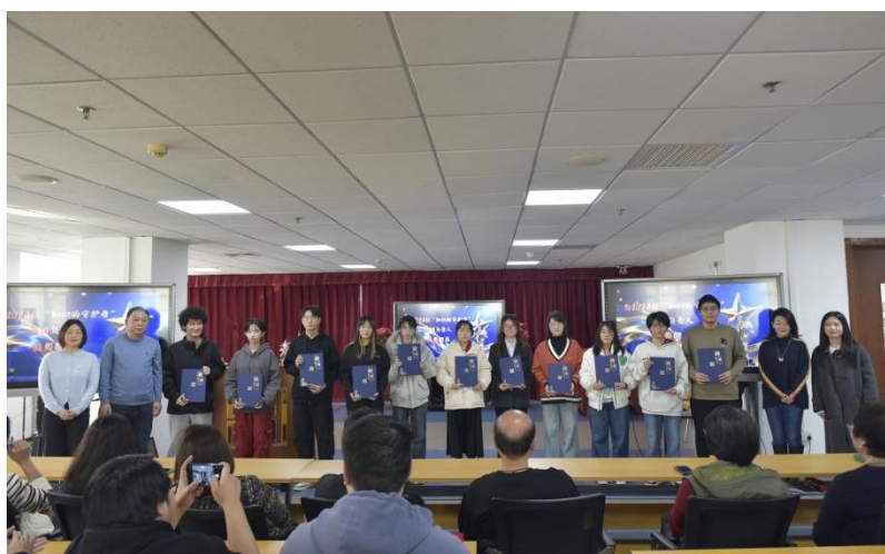
两校教师馆员代表为“知识的守护者”社团 2024 级学生馆员负责人颁发聘期聘书