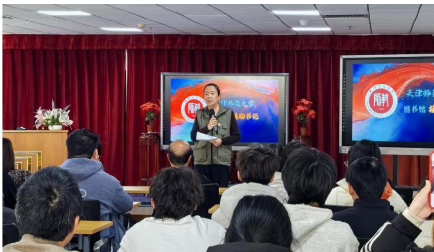
天津师范大学图书馆接励书记致辞

2025 年 12 月 5 日，天津中德应用技术大学图书馆与天津师范大学图书馆携手以“文脉传薪·守望同行”为主题，在天津师范大学图书馆成功举办了文化教育活动。两校图书馆负责人、师生馆员代表参加了活动。