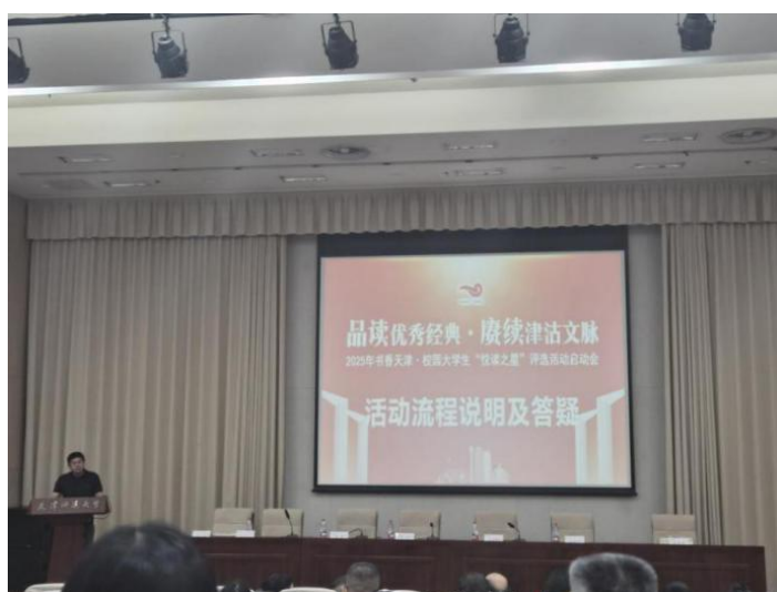
2025 书香天津·校园大学生“悦读之星”总决赛启动会

鉴于 2025 年书香天津·校园大学生“悦读之星”评选决赛规则的新变化，暑期，图书馆召开了专题动员会，从研读赛事新规则、分析核心指标、筹备参赛选手相关材料及定稿参赛作品等方面入手，举全馆之力进入“积极备战”状态。此外，辅导教师还通过线上交流的方式对决赛参赛选手进行辅导，期待中德学子能以最佳风貌诠释天津中德应用技术大学文化育人的成果。