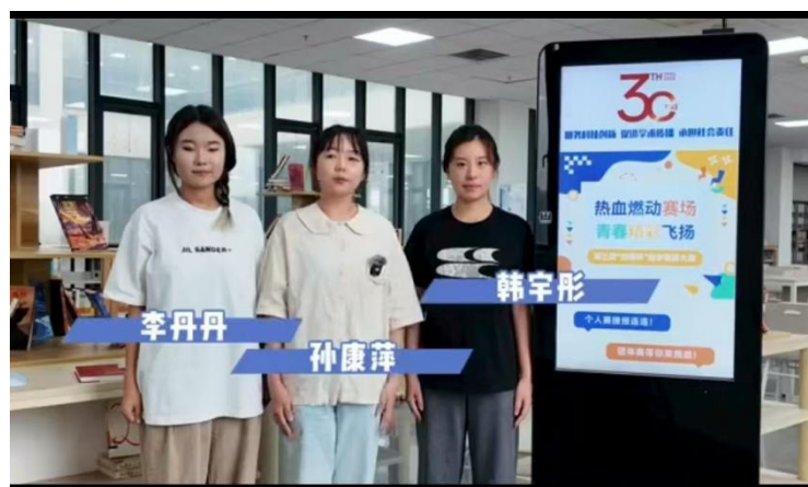
经贸管理学院“管苑青禾队”参赛学生

近日，由天津市高等学校图书情报工作委员会、天津高等教育文献信息中心、天津理工大学图书馆与同方知网联合主办、天津市各高校图书馆协办的第三届“知网杯”天津高校数字素养大赛圆满落下帷幕。天津中德应用技术大学荣获团体三等奖、团体优秀奖及优秀指导教师奖等多个奖项。