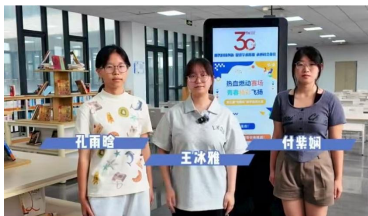
艺术学院“文枢星野队”参赛学生

在团体比赛中，天津中德应用技术大学选派的“管苑青禾队”和“文枢星野队”以扎实的学识基础和出色的表现分别斩获三等奖和优秀奖，充分展示了图书馆在学生信息素养培养及综合能力培育等方面的教育成果。