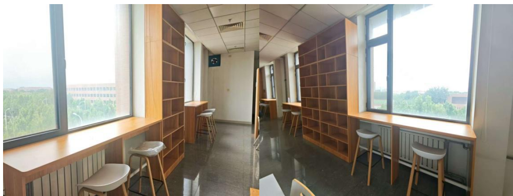
四楼文社馆智慧学习空间